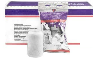
Bandes de résine

⚠️ Produit prescriptible mais non remboursable