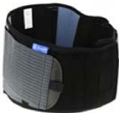
Ceinture de soutien rachis-lombaire