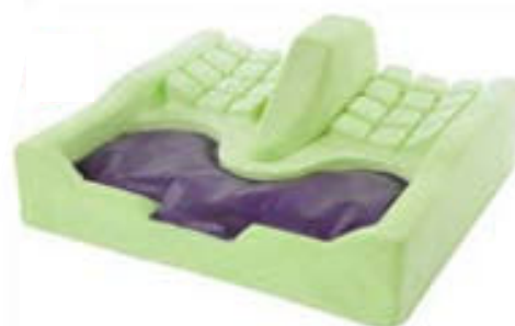
Coussin anti-escarre mixte : mousse / gel