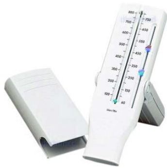
Débitmètre de pointe