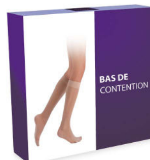
Bas de contention