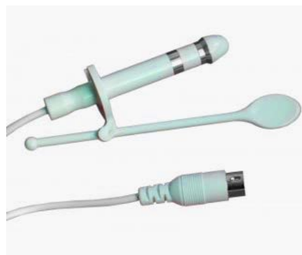
Sonde pour stimulation anale