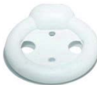
Pessaire vaginal en anneau