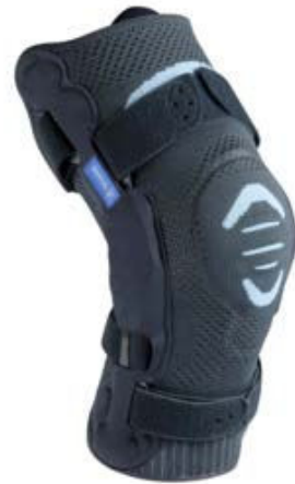
Genouillère ligamentaire articulée