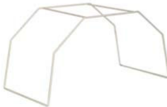
Arceau de lit