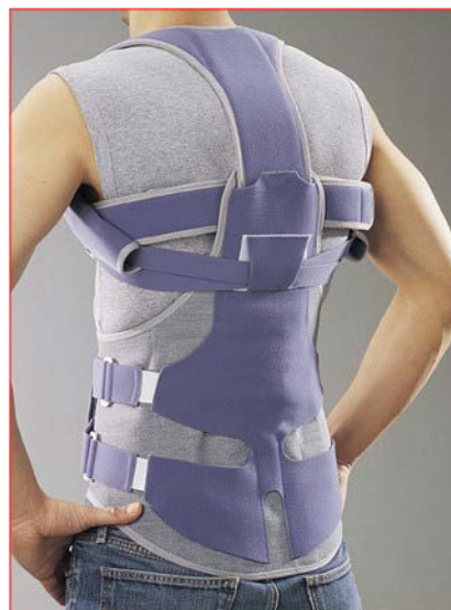
Corset de soutien du rachis