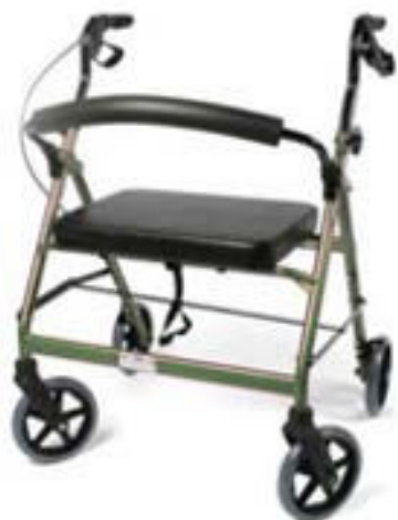
Déambulateur à propulsion manuelle