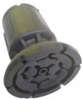
Embout de canne anglaise

! Produit prescriptible mais non remboursable