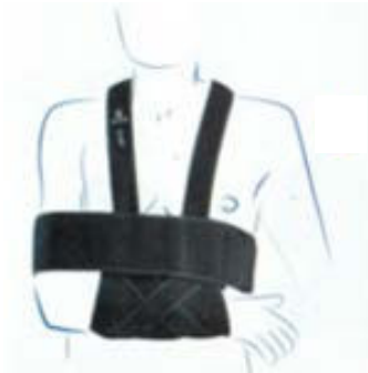
Gilet d'immobilisation scapulo-humérale

⚠️ Produit prescriptible mais non remboursable