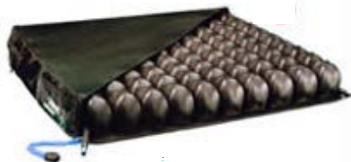
Coussin anti-escarre type 2 (à air)