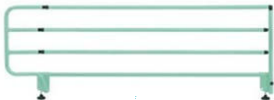
Barrière de lit