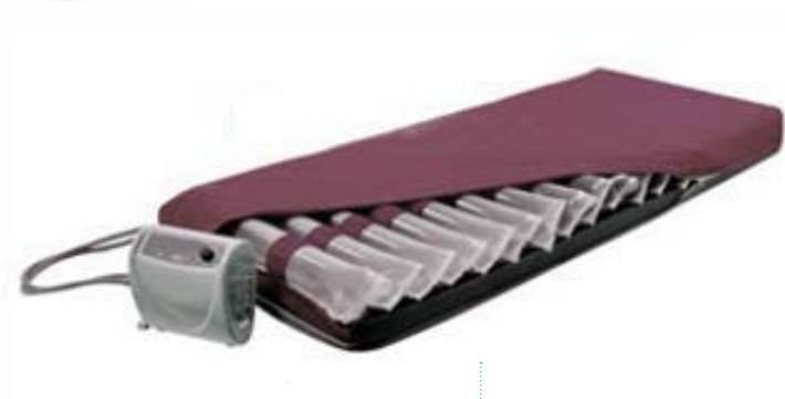
Matelas anti-escarre à air