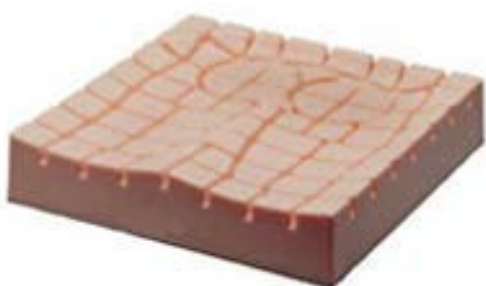
Coussin anti-escarre en mousse monobloc type 1

En fibres siliconées ou en mousse monobloc