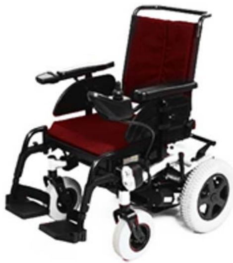
Fauteuil roulant à propulsion électrique (classe 2)