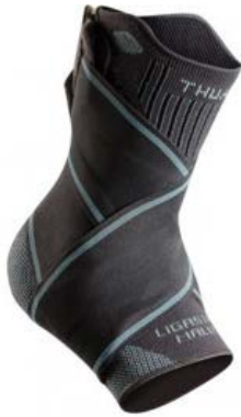
Chevillère proprioceptive et ligamentaire