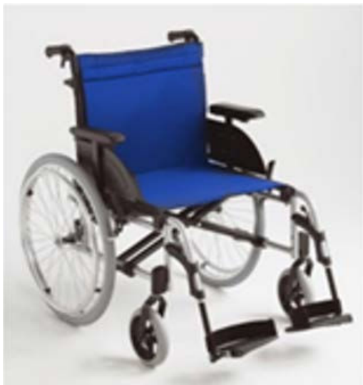
Fauteuil roulant à propulsion manuelle (ex classe 1)